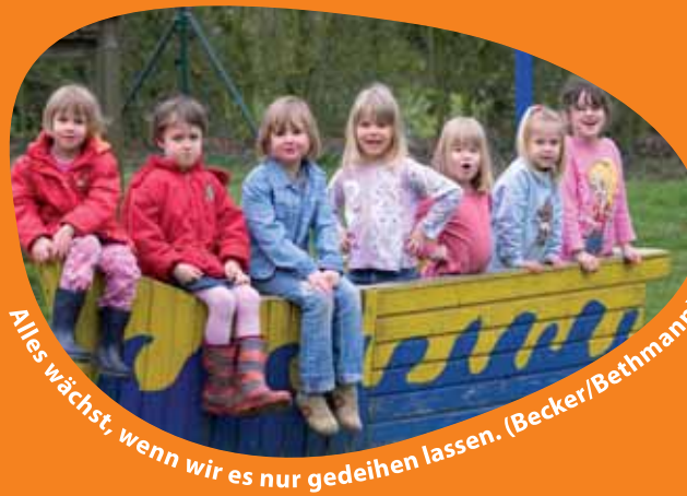
Alles wächst, wenn wir es nur gedeihen lassen. (Becker/Bethmann)